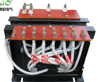
UV 固化变压器(卤素安电器)