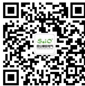
赛欧电气微信公众号