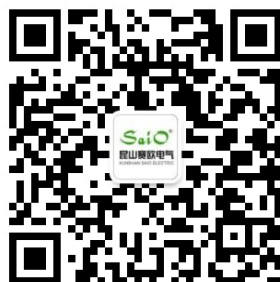
赛欧电气微信公众号