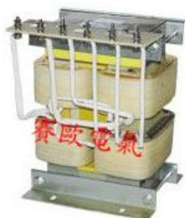
UV 固化变压器 (普通 UV)