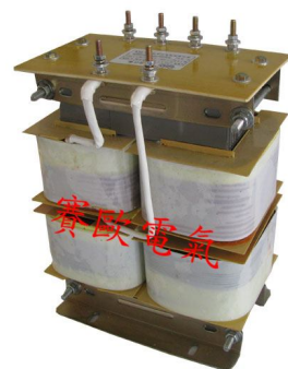
UV 固化变压器 (普通 UV)

注说明,否则我们只会按通用标准制作,这样不一定可以与贵司非标设备要求相匹配或通用,我司可以根据客户要求贴心为您定制。