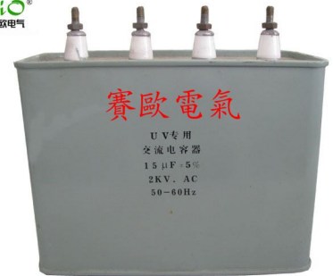
UV 固化变压器（卤素安电器）